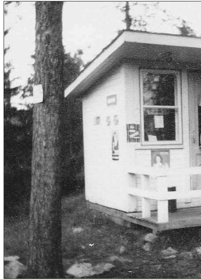
Aitoniemen Suvikioskissa Hirstojen nuoriso auttoi äitiä kaupankäynnissä.