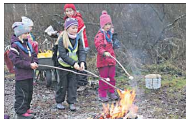
Härmälästä tulleet Ilvestytöt olivat jo tulensa sytyttäneet ja saivat paistaa tikkupullia.

Tehtävistä järjestäjät saivat sekä sudenpennuilta että saattajilta paljon positiivista palautetta: mieluisimpia rasteja olivat olleet Perttulan Navetalla sijainnut Noitavuoren labyrintti ja kalastusrasti Hauen hammas, jossa piti yhteistyöllä napata hauki omatekoiseen silmukkaan. Mukavia tehtäviä olivat olleet myös oravan